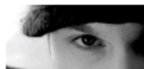
Budam, l'enfant des îles Féroé