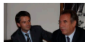
"Espoir : gagner"