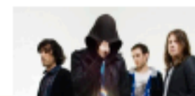
Stuck in the sound et The Lanskie au BBC