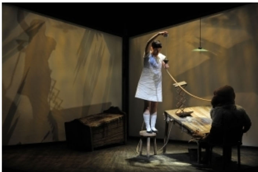
Comment ai-je pu tenir là dedans ?

Du 21 février au 1er mars 2013 - Nouveau Théâtre de Montreuil, 93100 Montreuil