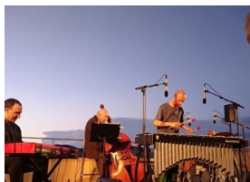
Les « Noches de verano » à la Pedrera