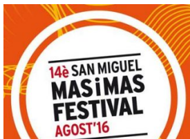
Festival Mas i Mas : éclectisme barcelonais