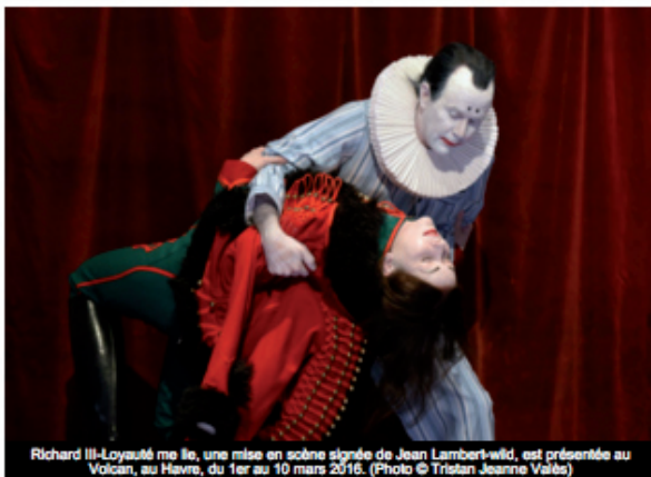
Richard III-Loyauté me lie, une mise en scène signée de Jean Lambert-wild, est présentée au Volcan, au Havre, du 1 er au 10 mars 2016.

Mise à jour : 27/02/2016 par Solène Bertrand