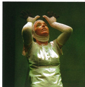
Comment ai-je pu tenir là-dedans ?

Je prépare la version japonaise, on va jouer à Dublin et nous avons des contacts à New York... C'est une chèvre qui va beaucoup voyager !